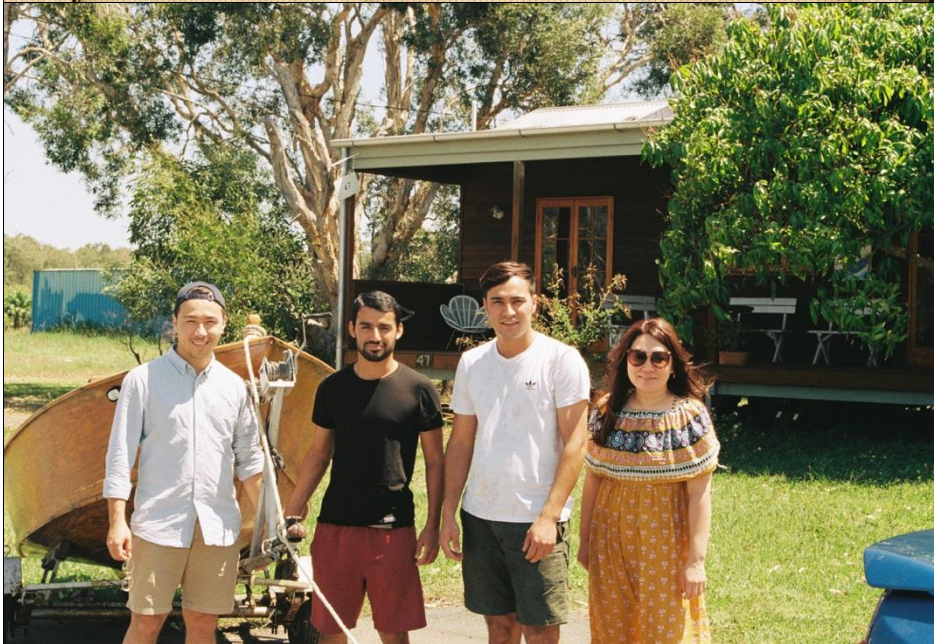
與挪威室友至他朋友 家的木屋滑獨木舟