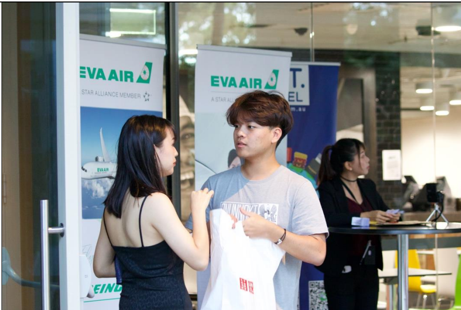
拍攝於昆士蘭台灣 學生會迎新會