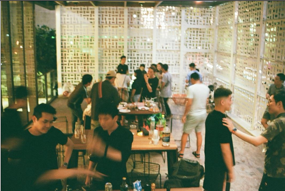
我邀請大家到宿舍的公共空間聚會